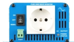
Phoenix Inverter 12/180 with Schuko socket